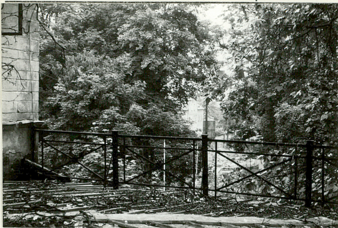
Widok od fasady pałacu na grupę drzew oddzielającą go od folwarku; w głębi oficyna