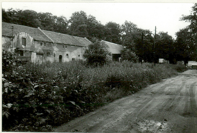
Gł. droga folwarczna, w kier. pałacu, z lewej budynki inwentarsko-gosp.