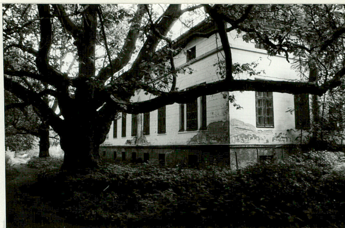
Widok elew. pd.-wsch. pałacu z pomnikowymi platanami i drogą obok