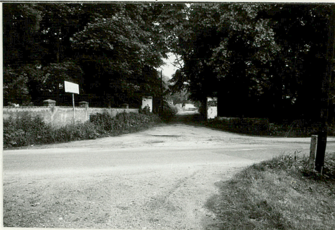
Gł. brama i droga wjazdowa na folwark.