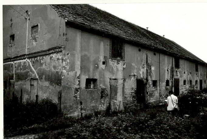
Budynek gosp. /nr 11/