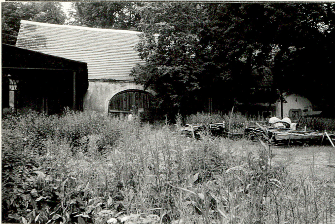
Budynek gosp. / nr 9/