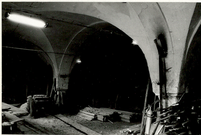
Wnętrze warsztatu stolarskiego w budynku nr 18