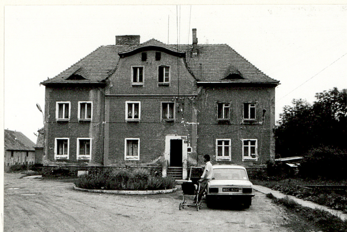
Oficyna /nr 15/