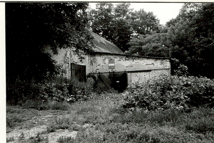
Dobudówka budynku z poprzedniej fot.