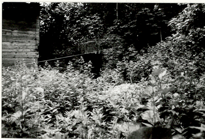
Ruiny pieca /nr7/