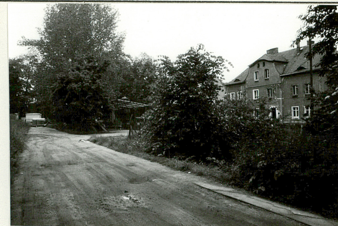
Gł. droga folwarczna biegnąca w kier. pałacu, z prawej oficyna mieszk.