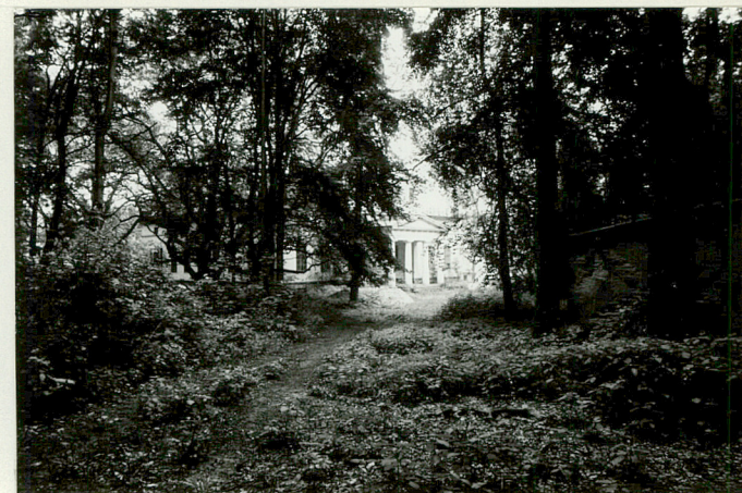
Droga dojazdowa do pałacu /omijająca folwark/; w głębi - portyk