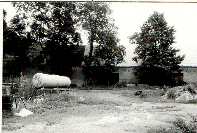
Budynek gosp. /nr 8/