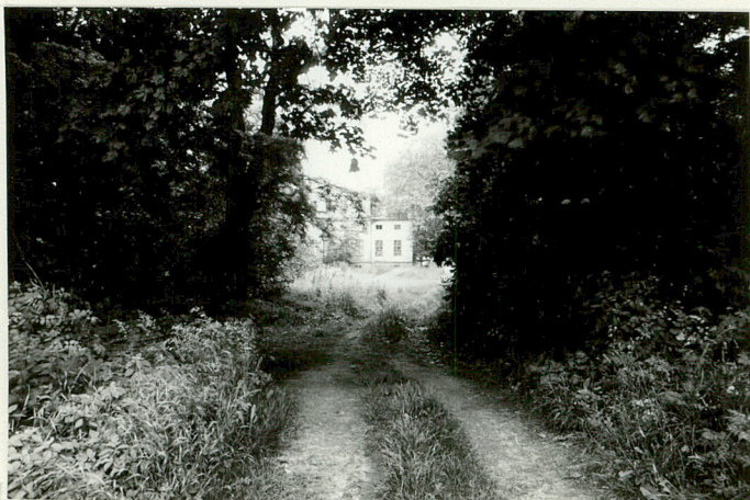
Pn.-zach. granica zespołu Droga wiodąca z pól w kier. pałacu, w głębi elew. ogrodowa.