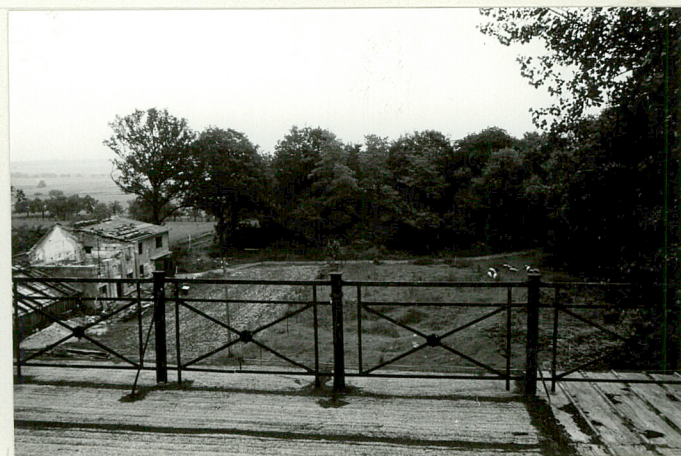
Widok z pałacu na park w kier. pn., z lewej - ruina oranżerii i domku ogrodnika