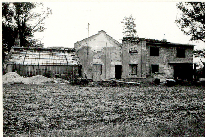
Ruiny oranżerii i domku ogrodnika