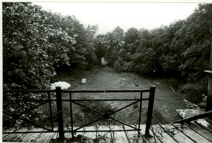
Widok z pałacu na park, w kier. pn.-zach.