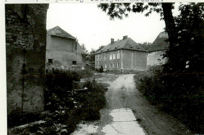
Widok na zabudowania gosp. z bocznej drogi folwarcznej

Wkładkę założył: ..... Ewa Sawińska ..... 5.07 1991 ..... (imię, nazwisko, data)