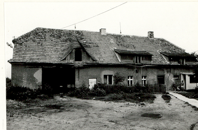
Budynek gosp.-mieszk. /nr 13,14/