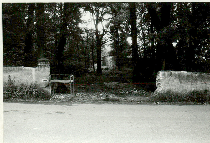
Resztki bramy rozpoczynającej drogę do pałacu, na tyłach folwarku /nieistniejąca/