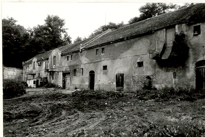
Gosp. budynek folw. /nr 18/