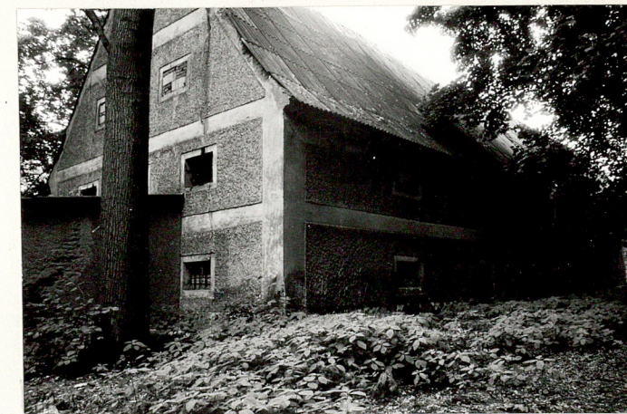
Budynek gosp. /nr 9/