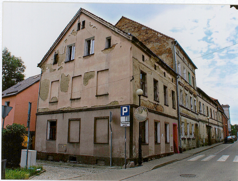
Widok od strony pñ.- zach.