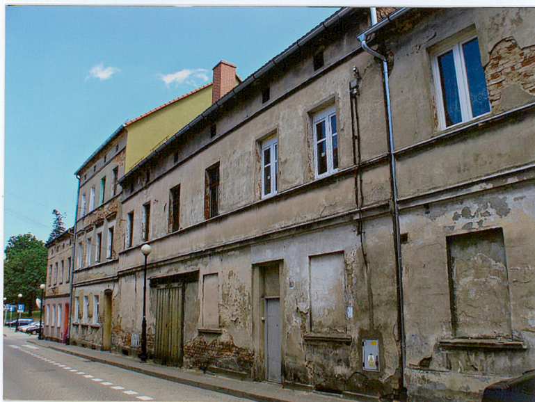
Widok od strony zach.