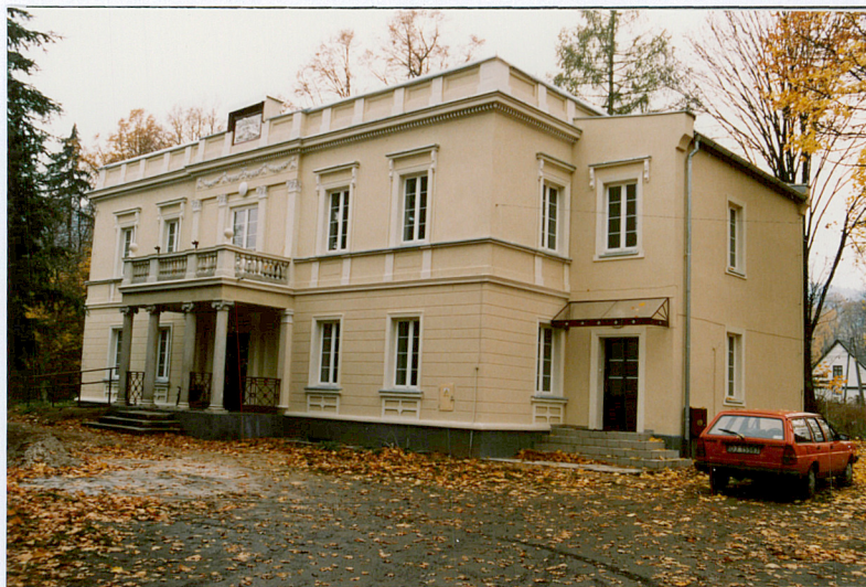
1. Widok od strony frontowej.