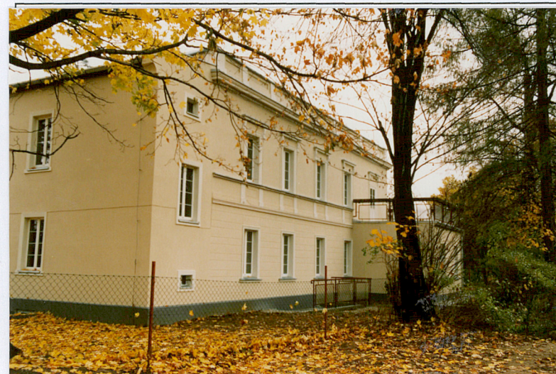
3. Widok od strony zach.