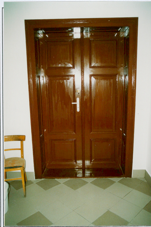
8. Drzwi wewnętrzne, hol.