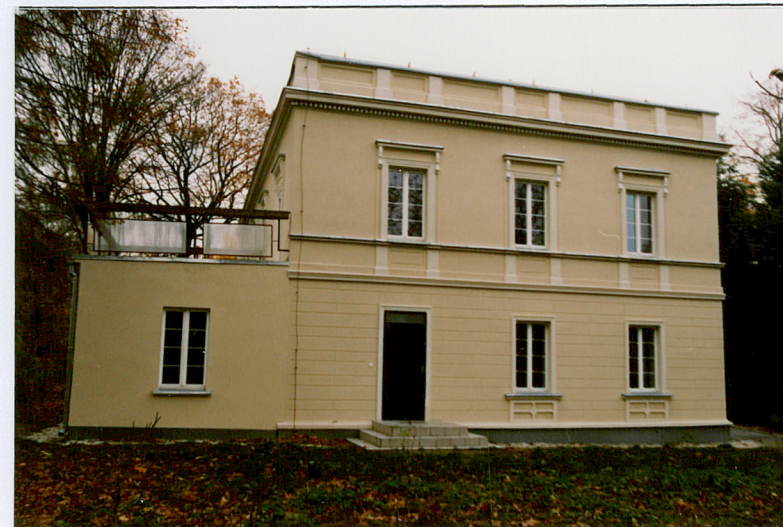
2. Widok od strony pd.-wsch.