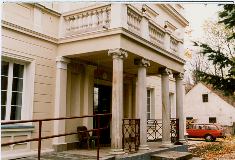
4. Portyk przed wejściem.