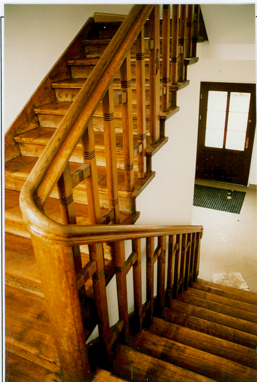
10. Klatka schodowa.

OPIS PARKU: Park przy willi znajduje się na działce zbliżonej kształtem do prostokąta wydłużonego w kierunku wsch. – zach., lekko pochylającego się na północ. Historyczne granice założenia nie zachowały się do dzisiaj, od strony południowej i zachodniej teren został ograniczony współczesnymi wydzieleniami geodezyjnymi, od str. wsch. założenie graniczy z zabudowaniami willowymi, od północy park ogranicza ul. Kamiennogórska. Teren ogrodzony jest metalową siatką rozpiętą na metalowych słupach osadzonych na podmurówce.