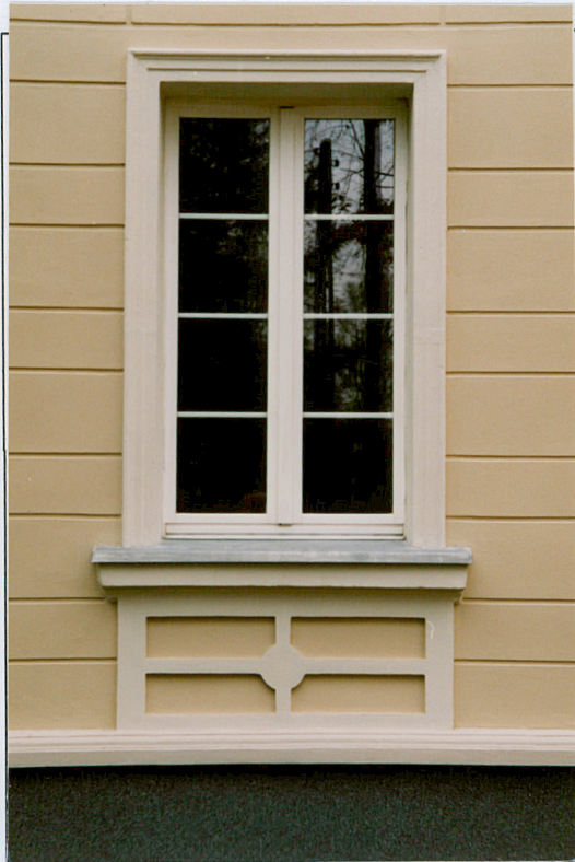
7. Okno górnej kondygnacji.