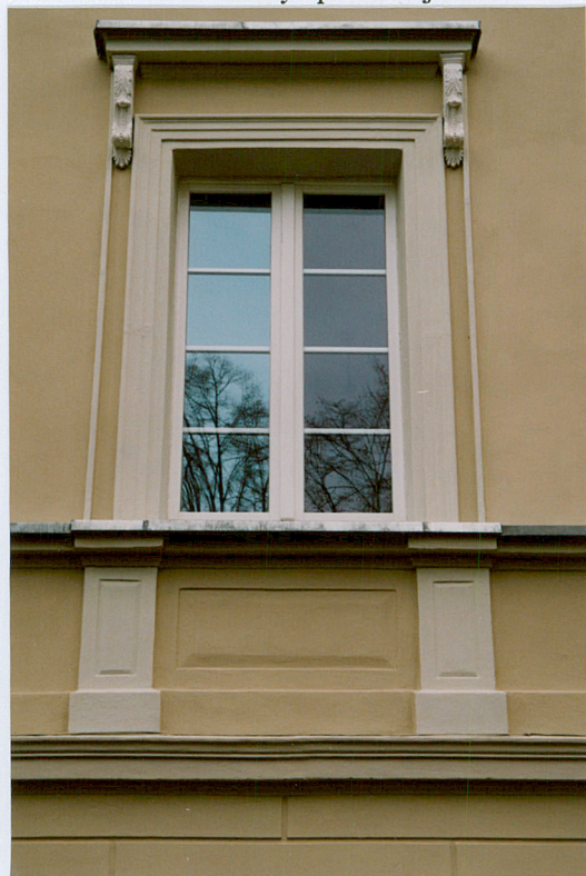
6. Okno dolnej kondygnacji.