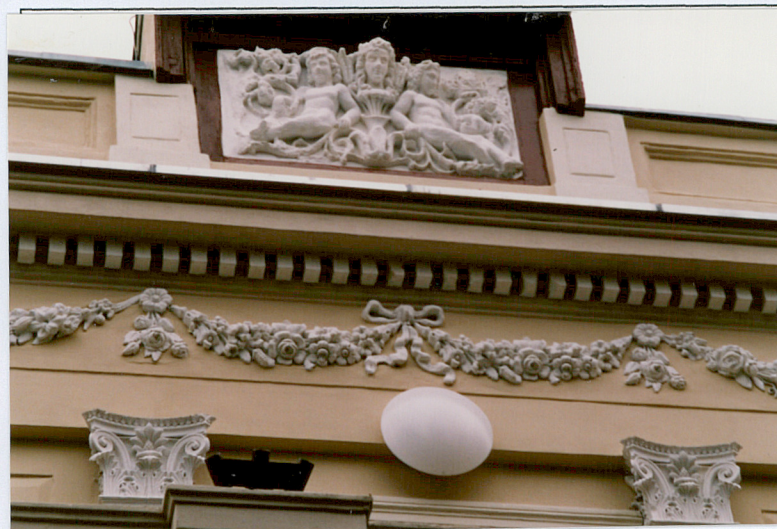
5. Dekoracja nad portykiem.