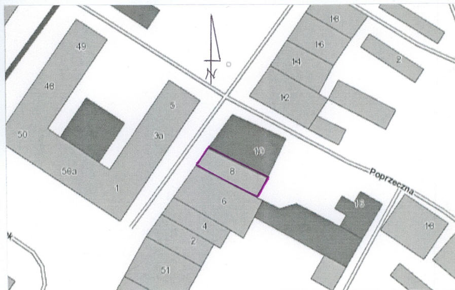
Plan sytuacyjny, skala 1: 1000