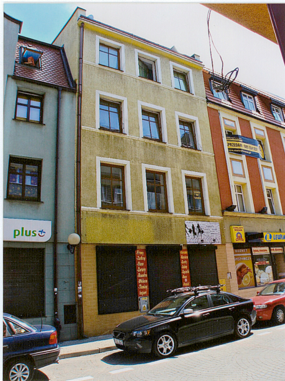
Widok od strony zach.