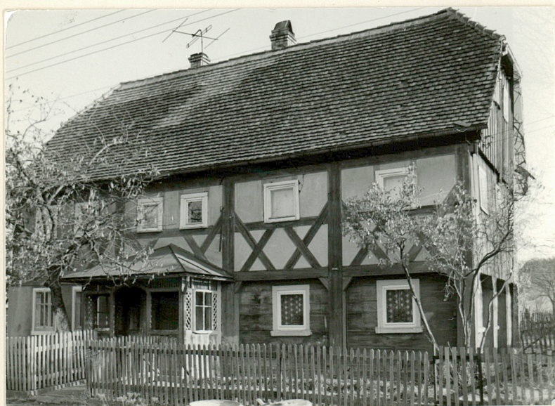
autor zdjęć Z. Niziałkowski, data wykonania X. 1979 r. miejsce przechowywania negatywów WKZ Jelenia Góra