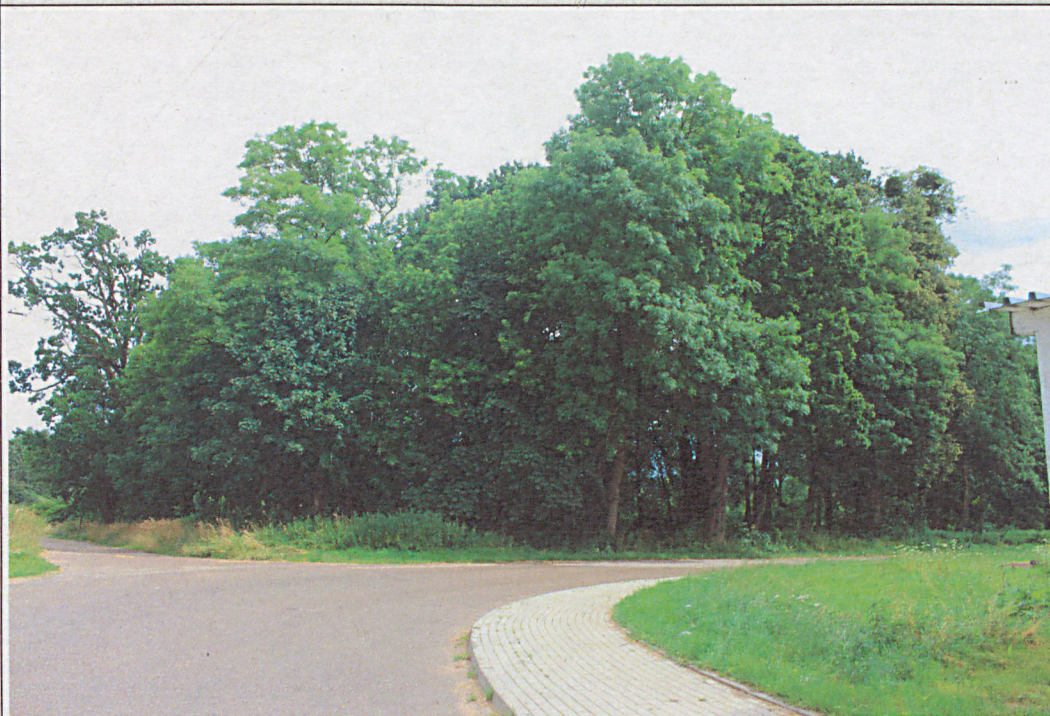
Widok ogólny cmentarza