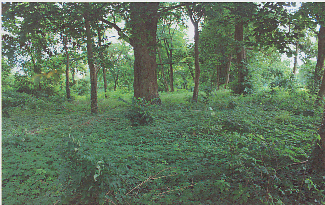
Wnętrze cmentarza w Arklitach, stan w 2020r.