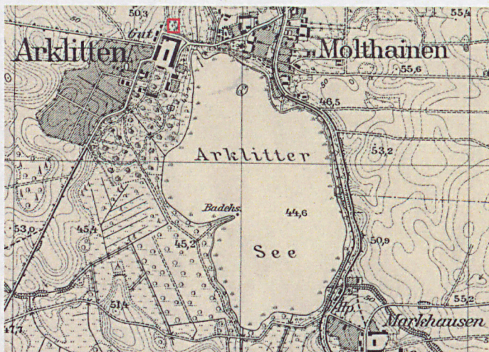
Mapa niem. Arklit z zaznaczonym cmentarzem