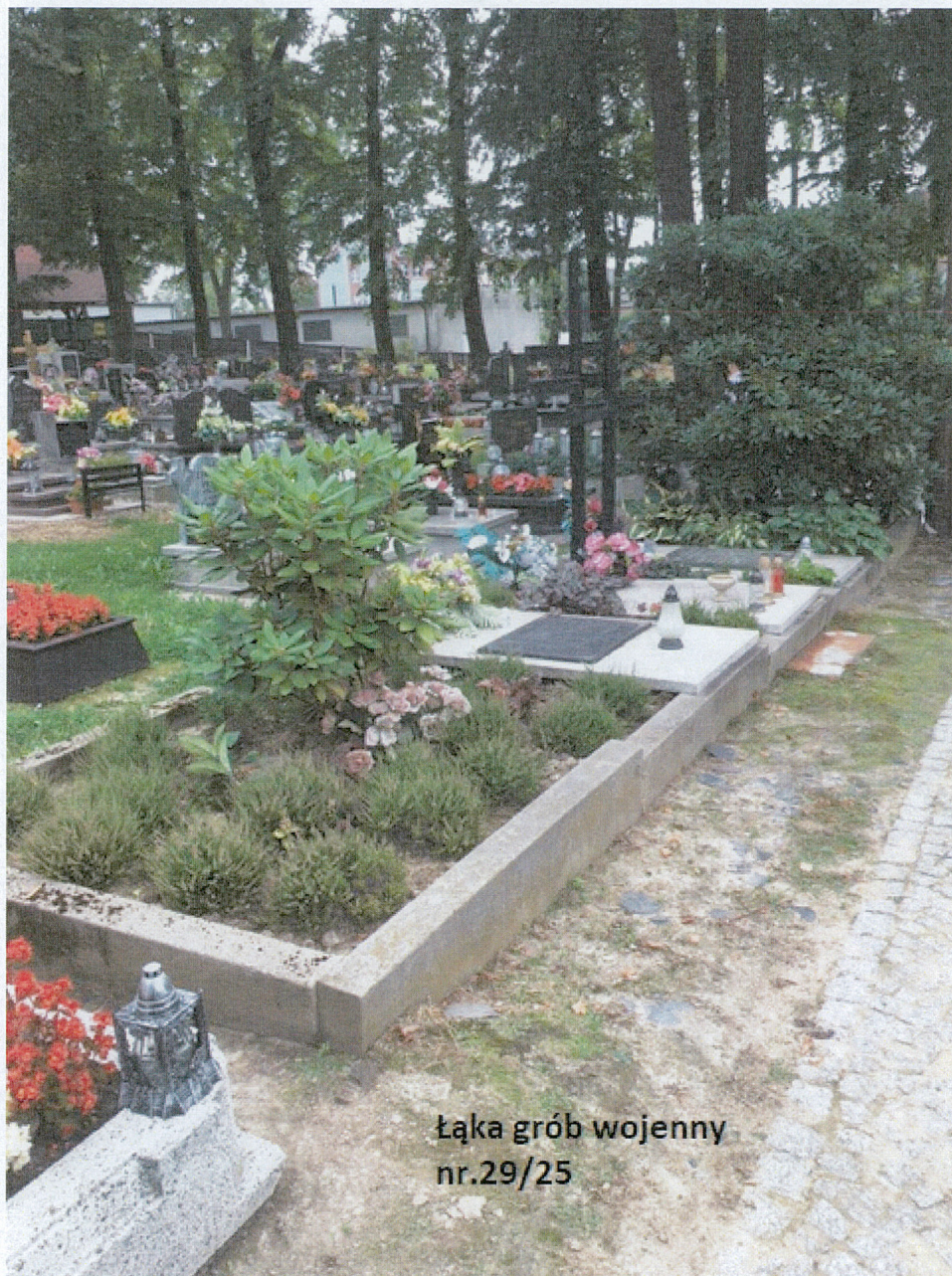
Łąka grób wojenny nr. 29/25

ŁĄKA CMENTARZ PARAFIALNY NR. 29/25 (2020 r.)