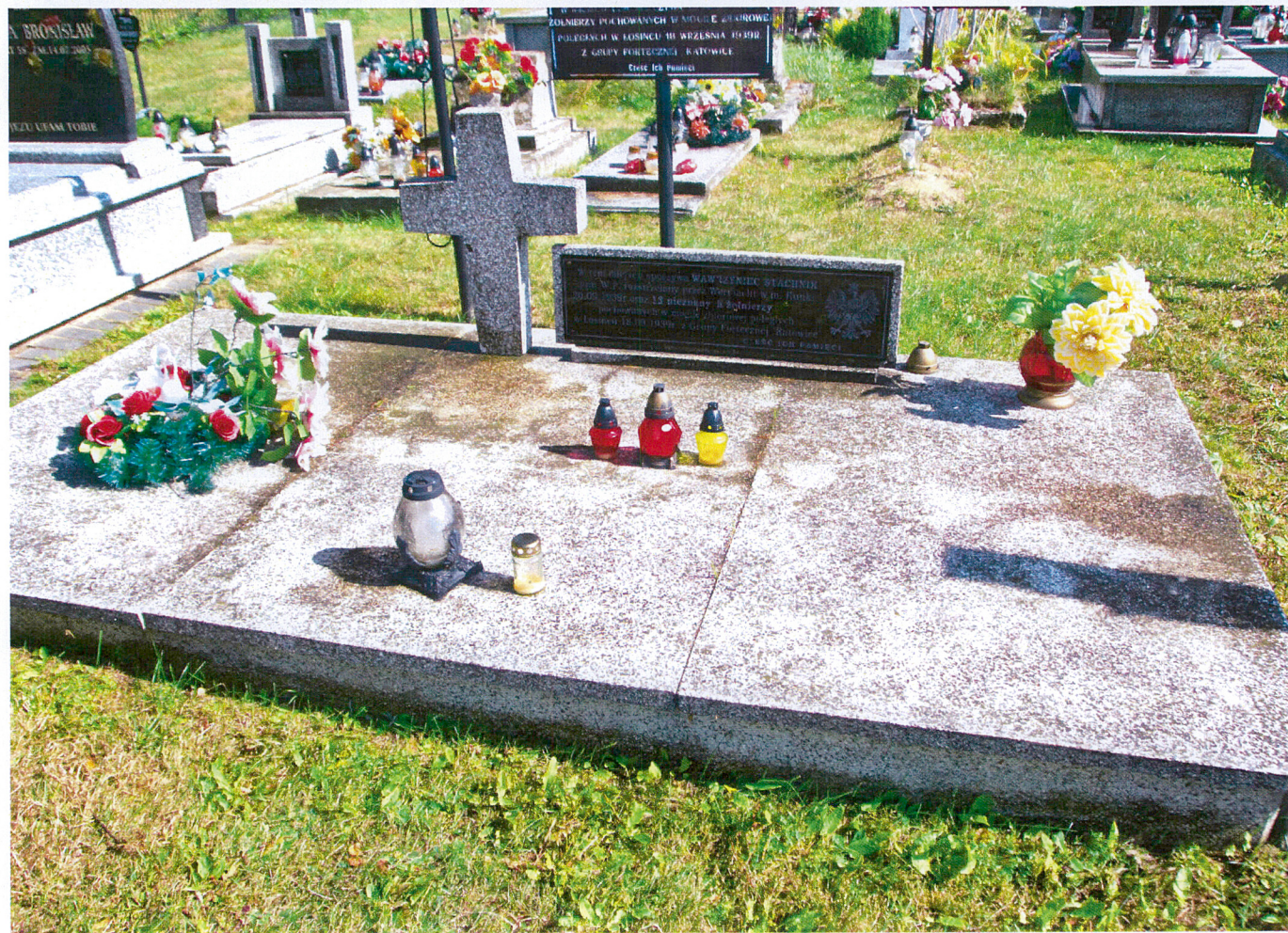
Moгила збіборона на цментарыі парафіяльнай у Łosicach