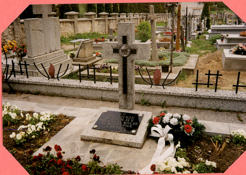
CMENTARZ PARAFIALNY - MOGIŁA ZBIOROWA ŻOŁNIERZY WOJSKA POLSKIEGO (fot. 1999r.)