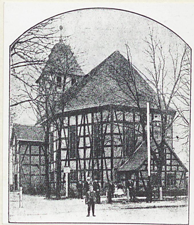
Niezachowany kość. z 1755r. wg foto z k.XIXw.