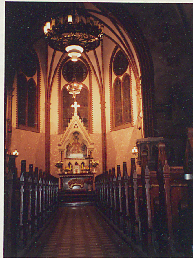
2. Wnętrze prezbiterium