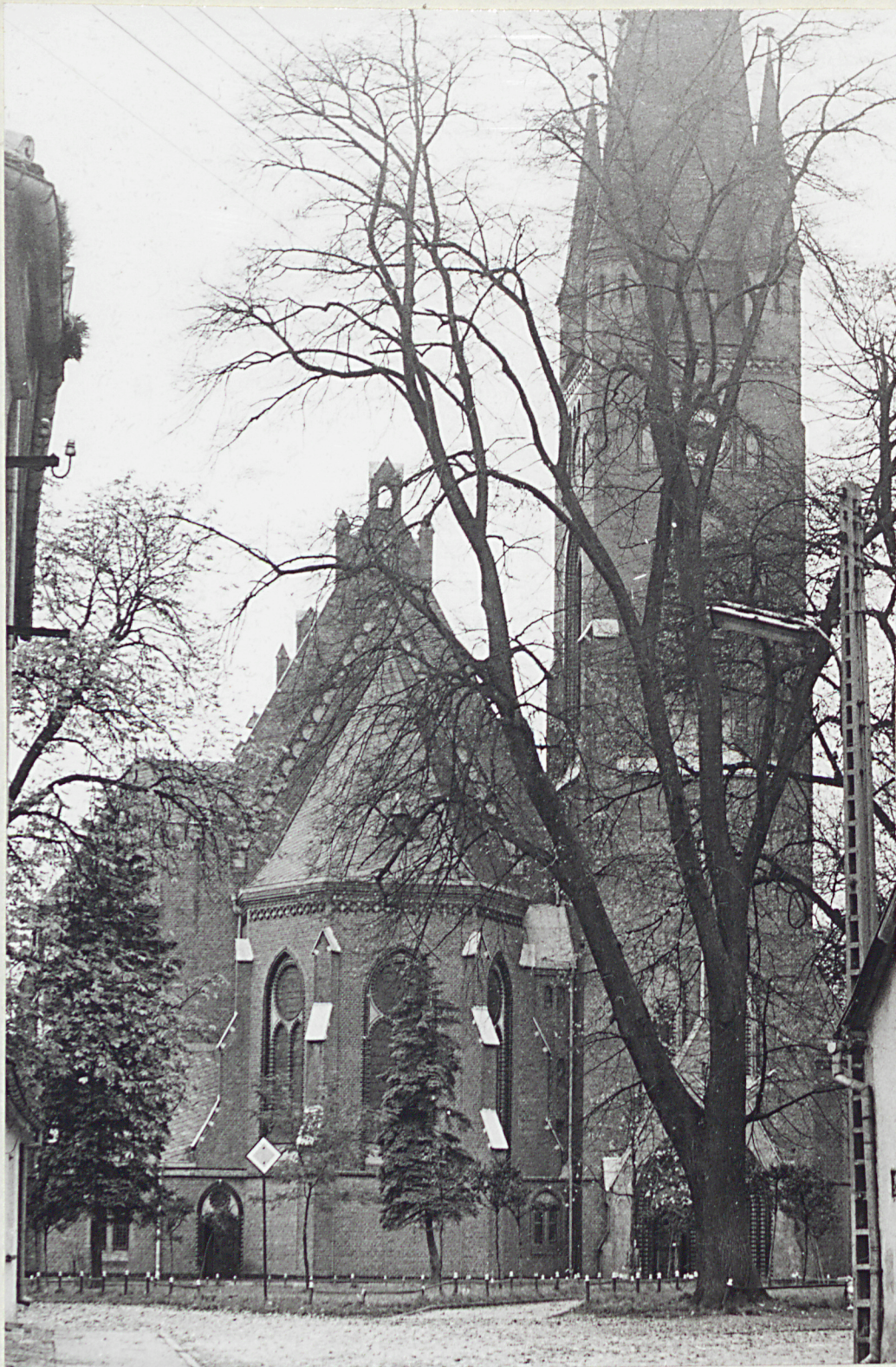
1. Widok od strony wschodniej