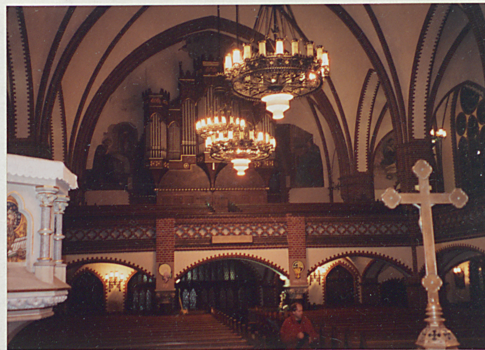
3. Wnętrze nawy głównej