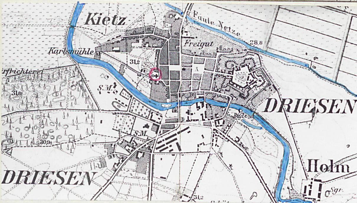
Plan miasta z pocz XXw.

1. Miejscowość DREZDENKO 2. Obiekt (nazwa jak w karcie) KOŚC. PAR. 3. Zawartość wkładki (nazwa obiektu lub materiału uzupełniającego) Plan miasta z pocz. XXw., widok kośc. z 1755r. /rozebranego/ 3. Fotografie stanu obecnego