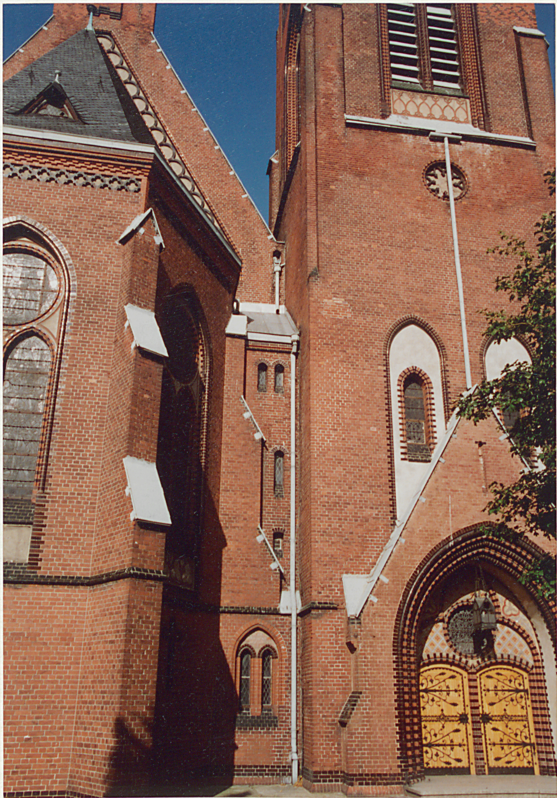
Fragment elewacji wschodniej .