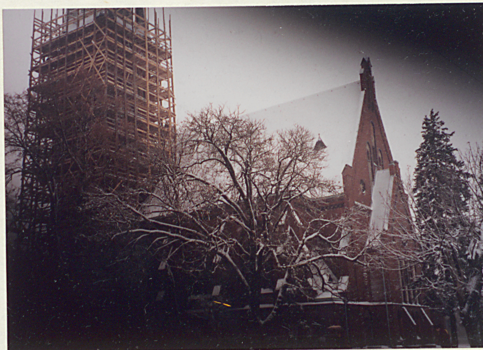
Widok od strony północno-zachodniej.